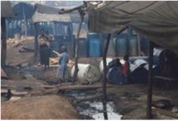
Makenke: leven tussen de vervuiling