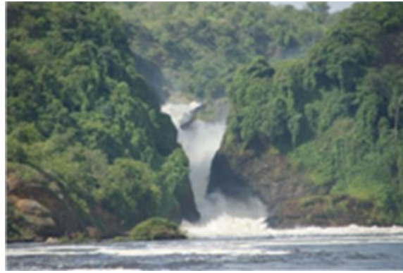
Murchisson Falls: de machtige Nijl